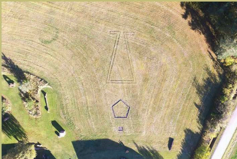
Dokumentation af jordværket KENOTAPH (NORD) - MAUSOLEUM (MAIOR-MINOR) - QUADRAT (2022); 50 × 4110 × 1140 cm. Prøvemarken, Læsø AIR, oktober 2022.

Billedkunstneres Forbund får heldigvis hele tiden mange nye medlemmer. På denne plads præsenterer Billedkunstneren et af dem. Denne gang møder vi: